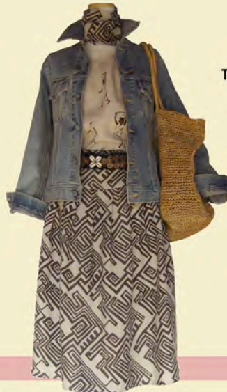
<< タンクトップ A-238 ¥13,650 スカート A-385 ¥28,350 ベルト A-922 ¥14,700