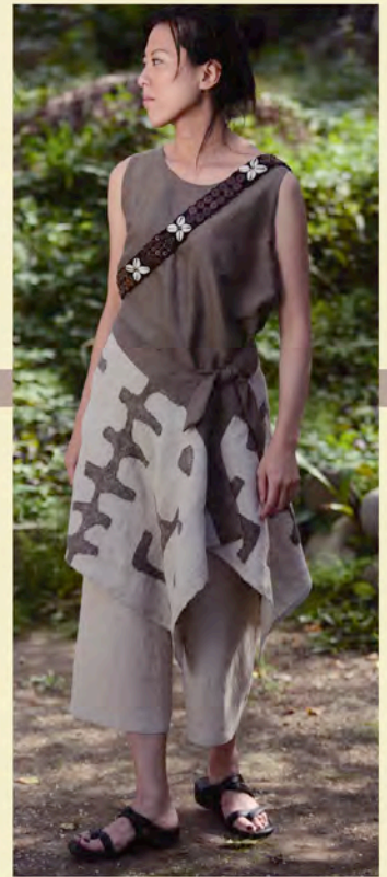
タンクトップ A-213 ¥11,550 スカーフ付パンツ A-462 ¥39,900