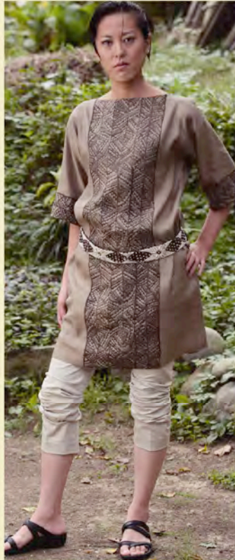
ワンピース A-530 ¥30,450 パンツ 参考商品 ベルト A-922 ¥14,700