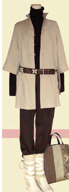
<< ブラウス A-164 ¥28,350 タートルプルオーバー A-710 ¥14,700 ベルト A-922 ¥14,700 バッグ A-971 ¥11,550