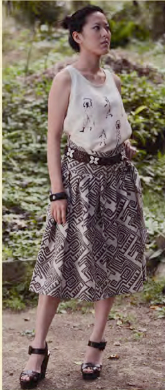
タンクトップ A-238 ¥13,650 スカート A-385 ¥28,350 ベルト A-922 ¥14,700

プランツアイテムでフルコーディネートすると、個性ある印象的な着こなしです。 スカーフやベルト、アクセサリといった小物で変化をつけると、さらに効果的。 ナチュラルなネイティブテイストがこれからのシーズンに映えます。