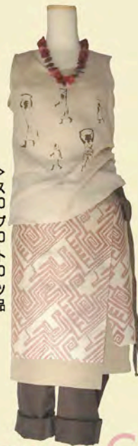
>> ネックレス TG-RED ¥13,650 タンクトップ A-238 ¥13,650 スカート A-389 ¥27,300 パンツ 参考商品