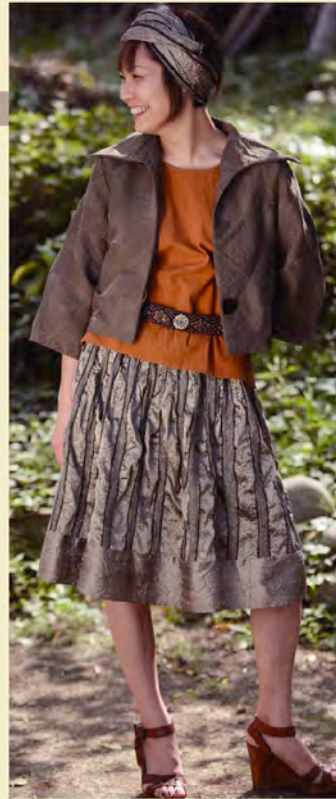
ジャケット A-606 ¥51,450 タンクトップ A-239 ¥11,550 スカート A-357 ¥51,450 ベルト A-922 ¥14,700