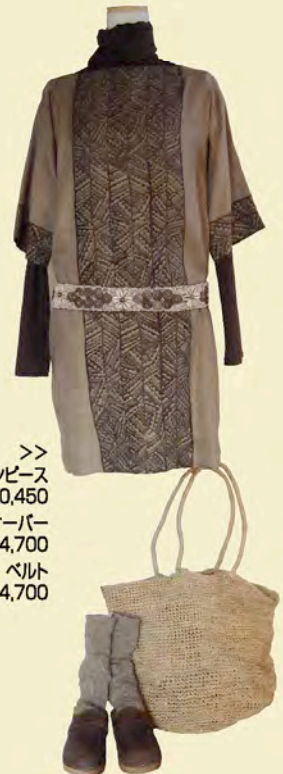
>> ワンピース A-530 ¥30,450 タートルプルオーバー A-710 ¥14,700 ベルト A-922 ¥14,700